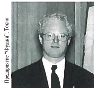
Предприятие "Фуэжи", Токио