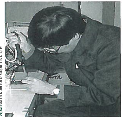
Архивы открытого моря FRI, UW

- Юкимаса Ишида Рыболовное Агентство Японии