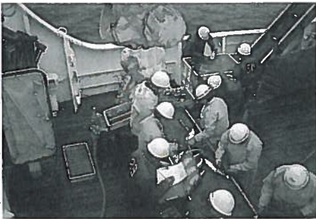
Архивы открытого моря FRI, UW